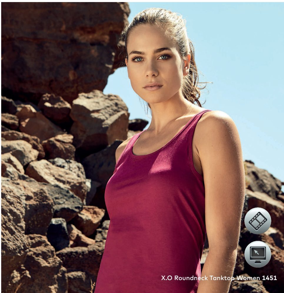
X.O Roundneck Tanktop Women 1451