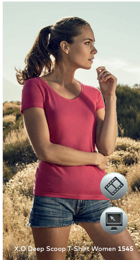
X.O Deep Scoop T-Shirt Women 1545

Einzigartiges Single-Jersey T-Shirt mit tiefem Ausschnitt und Self-Fabric Kragen, hergestellt aus langstapeliger gekämmter Baumwolle. Die besonders glatte Oberfläche und der weich fallende Stoff verleihen dem Shirt ein einzigartiges, elastisches und seidiges Finish. Das T-Shirt ist schmal geschnitten und mit Seitennähten gefertigt.