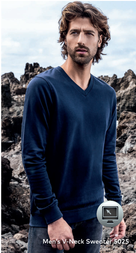
Men's V-Neck Sweater 5025