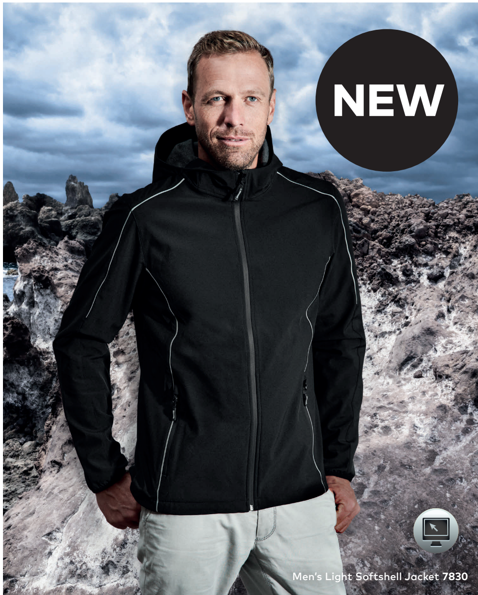
Men's Light Softshell Jacket 7830