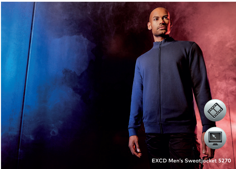
EXCD Men's Sweatjacket 5270