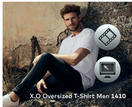
X.O Oversized T-Shirt Men 1410

Einzigartiges Oversized Single-Jersey T-Shirt mit Self-Fabric Kragen, hergestellt aus langstapeliger gekämmter Baumwolle. Die besonders glatte Oberfläche und der weich fallende Stoff verleihen dem Shirt ein einzigartiges, elastisches und seidiges Finish. Das T-Shirt ist oversized geschnitten und mit Seitennähten gefertigt.