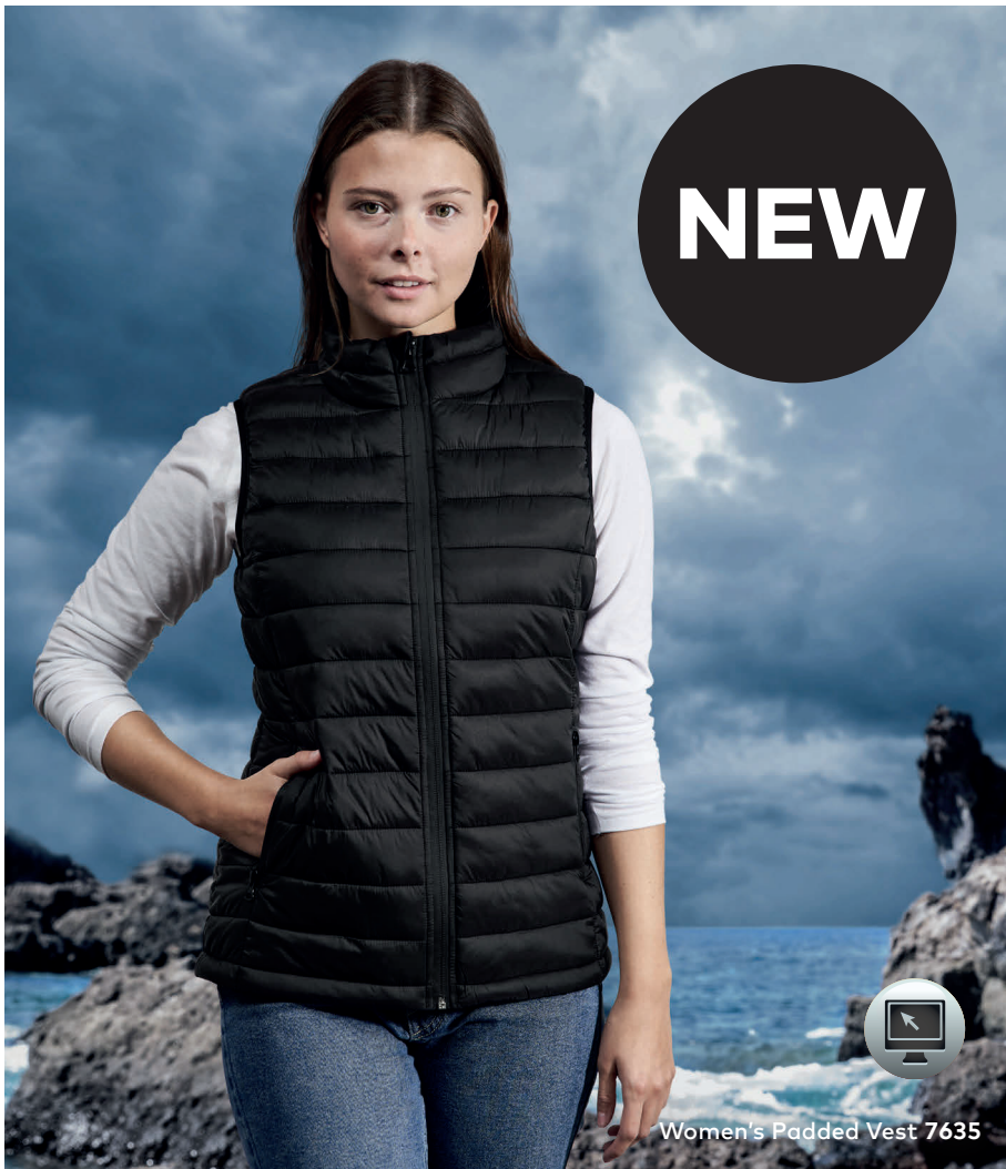
Women's Padded Vest 7635