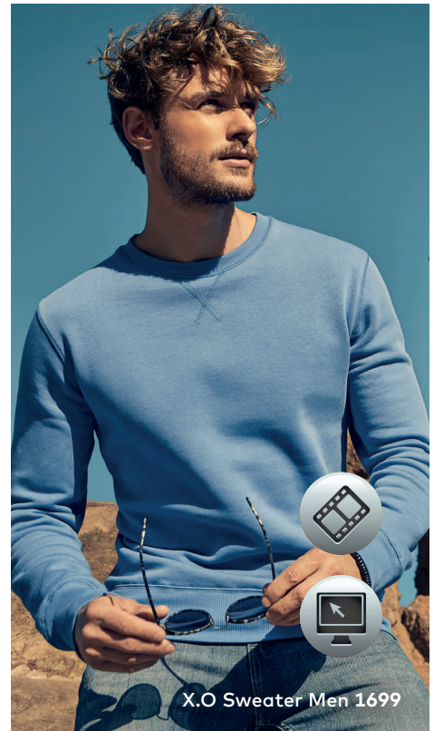
X.O Sweater Men 1699

Einzigartiges Molton-Mischgewebe-Sweatshirt mit angerauter Innenseite, Flatlock-Nähten und Elasthanbündchen an Hals, Ärmeln und Saum, hergestellt aus langstapeliger gekämmter Baumwolle und Polyester. Die besonders glatte Oberfläche und der weich fallende Stoff verleihen dem Sweatshirt ein einzigartiges, elastisches und seidiges Finish. Das Sweatshirt ist schmal geschnitten.