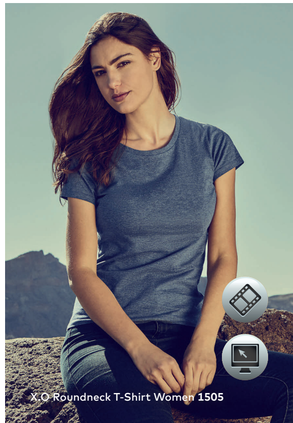
X.O Roundneck T-Shirt Women 1505

Einzigartiges Single-Jersey T-Shirt mit Self-Fabric Kragen, hergestellt aus langstapeliger gekämmter Baumwolle. Die besonders glatte Oberfläche und der weich fallende Stoff verleihen dem Shirt ein einzigartiges, elastisches und seidiges Finish. Das T-Shirt ist schmal geschnitten und mit Seitennähten gefertigt.