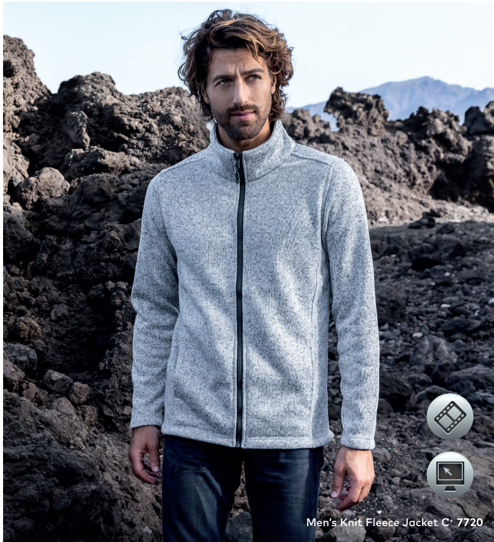
Men's Knit Fleece Jacket C + 7720