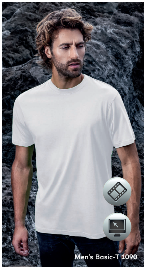
Men's Basic-T 1090

Zeitloses Single-Jersey-T-Shirt mit Elasthananteil im Rippbündchen, hergestellt aus gekämmter Baumwolle. Das T-Shirt ist klassisch geschnitten und aus Schlauchware gefertigt.