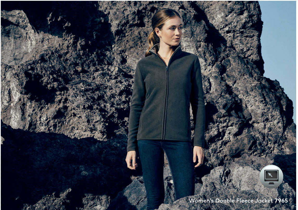
Women's Double Fleece Jacket 7965

Double-Fleecejacke mit Stehkragen und durchgehendem verdecktem Reißverschluss, Elasthanbündchen an Ärmeln sowie 2 Seitentaschen mit Reißverschluss. Die Innenseite der Jacke ist in Kontrastfarbe, hergestellt aus Polyester mit beidseitiger Anti-Pilling-Ausrüstung. Die Fleecejacke ist schmal geschnitten.