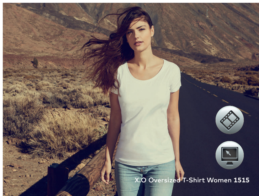
X.O Oversized T-Shirt Women 1515