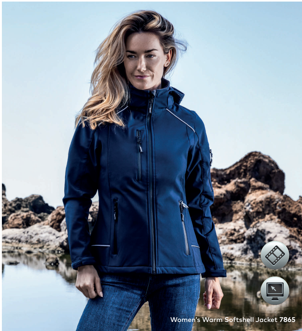
Women's Warm Softshell Jacket 7865