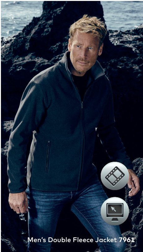
Men's Double Fleece Jacket 7961