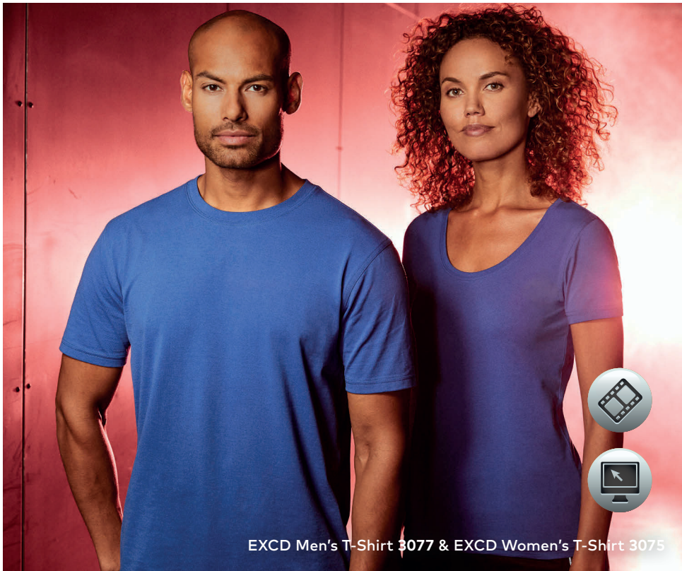
EXCD Men's T-Shirt 3077 & EXCD Women's T-Shirt 3075