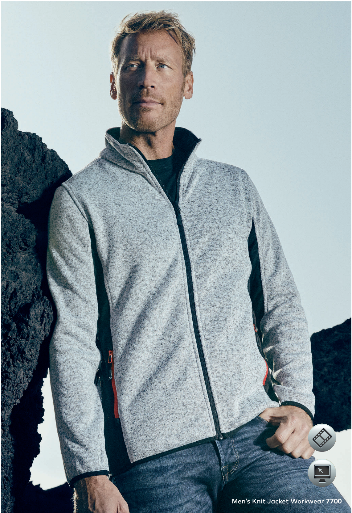
Men's Knit Jacket Workwear 7700