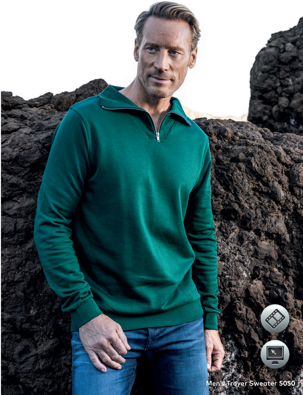
Men's Troyer Sweater 5050