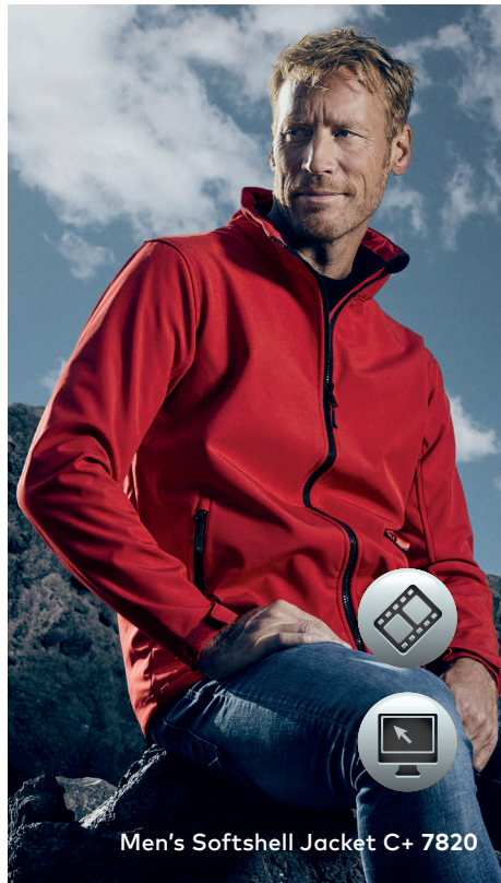
Men's Softshell Jacket C+ 7820

Softshelljacke, die besonderen Merkmale dieser Jacke: Reißverschluss mit Regen- und Kinnschutz, verstellbare Armabschlüsse mit Klettverschlüssen, Tunnelzug am Saum mit Kordelstopper innen, 2 Seitentaschen mit Reißverschluss, Fixierung für Außenjacke, atmungsaktiv, wasserdicht 8.000 mm, hergestellt aus bi-elastischem Bonded-Fleece aus Polyester mit Elasthananteil für mehr Bewegungsfreiheit. Die Jacke ist sportlich geschnitten. Jacken Konzept 6-in-1, kombinierbar mit Außenjacke 7548/7549.