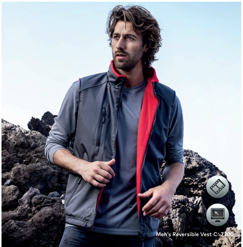
Men's Reversible Vest C+ 7200

Wendeweste, die besonderen Merkmale dieser Jacke: Stehkragen, Napoleontasche auf der Vorderseite, 2 Seitentaschen mit RV auf der Vorder-/Innenseite, eingnähter Schlüsselanhänger in Seitentasche, reflektierende Paspeln und RV Anhänger, Tunnelzug am Saum mit Kordelstopper, abgerundeter Saum, Invisible Zip zum Veredeln, Fixierung für Außenjacke, Fleece Innenseite mit Anti-Pilling Ausrüstung, hergestellt aus 100% Polyester. Die Weste ist modern geschnitten. Jacken Konzept 6-in-1, kombinierbar mit Außenjacke 7548/7549.