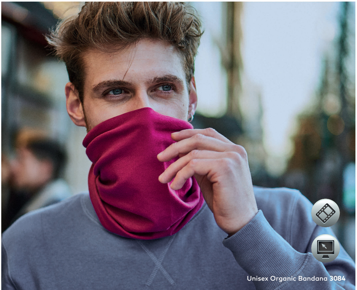
Unisex Organic Bandana 3084