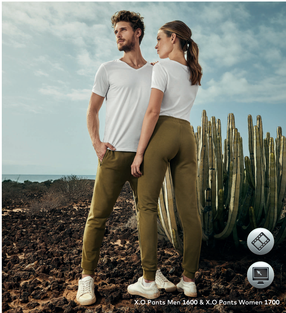
X.O Pants Men 1600 & X.O Pants Women 1700

Einzigartige Molton-Mischgewebe-Sweatpants, unbrushed, Bund mit Kordelzug, 2 Seitentaschen mit coated Ton-in-Ton Reißverschluss, Elasthanbündchen am Bund und Beinabschluss, hergestellt aus langstapeliger gekämmter Baumwolle und Polyester. Die besonders glatte Oberfläche und der weich fallende Stoff verleihen der Sweatpants ein einzigartiges, elastisches und seidiges Finish. Die Sweatpants ist schmal geschnitten.