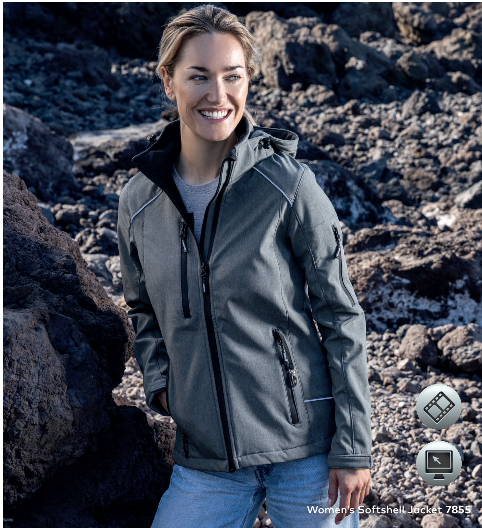
Women's Softshell Jacket 7855