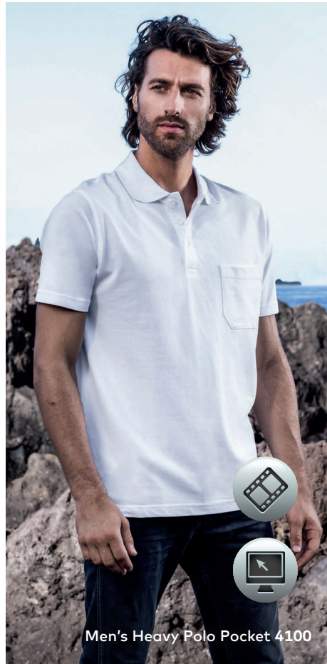
Men's Heavy Polo Pocket 4100

Zeitloses Piqué-Polo mit Brusttasche, Knopf- leiste mit 3 Knöpfen Ton in Ton, offene Arm- abschlüsse sowie Seitenschlitze, hergestellt aus gekämmter Baumwolle. Das Polo ist leger geschnitten.