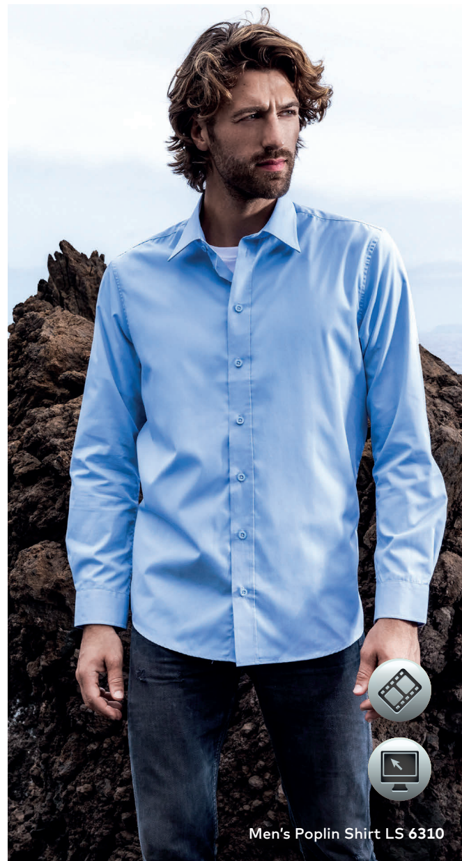
Men's Poplin Shirt LS 6310

Klassisches Popeline-Longarm-Mischgewebe-Hemd mit verstärktem Kent-Kragen und Knopfleiste mit Knöpfen Ton in Ton sowie separater Brusttasche und Ersatzknöpfen. Die besonderen Merkmale dieses Hemdes: pflegeleichtes Mischgewebe, Abnäher vorne und hinten für Women, verstellbare 2-Knopf-Manschette (Sportmanschette), lange Ärmelschlitze mit Knopf, doppelte Rückenpasse, abgerundeter Saum, hergestellt aus Baumwolle mit Polyester. Das Hemd hat einen modernen Schnitt. Klassisch einzeln verpackt.