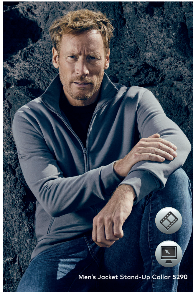
Men's Jacket Stand-Up Collar 5290

Klassische Molton-Sweatjacke mit angerauter Innenseite und Elasthanbündchen an Ärmeln und Saum, Stehkragen, durchgehendem, verdecktem Ton in Ton-Reißverschluss sowie 2 Seitentaschen mit Reißverschluss, hergestellt aus gekämmter Baumwolle. Die Sweatjacke ist modern geschnitten.