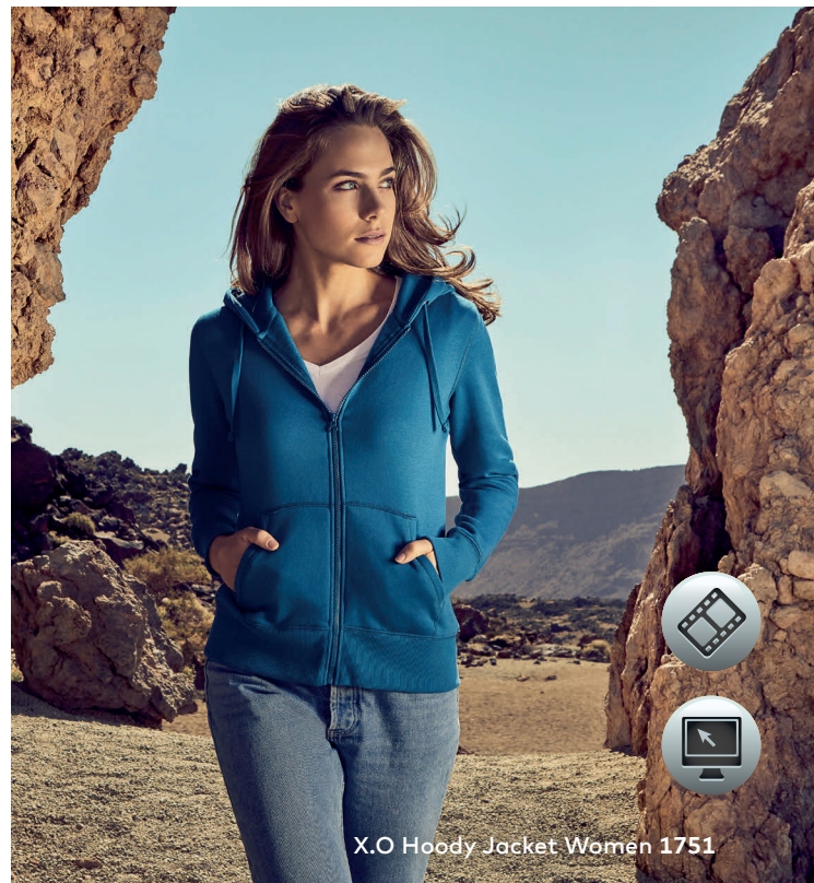
X.O Hoody Jacket Women 1751

Einzigartiges Molton-Mischgewebe-Kapuzensweatjacke mit angerauter Innenseite, Kängurutasche und Elasthanbündchen an Hals, Ärmeln und Saum, hergestellt aus langstapeliger gekämmter Baumwolle und Polyester. Die besonders glatte Oberfläche und der weich fallende Stoff verleihen der Sweatjacke ein einzigartiges, elastisches und seidiges Finish. Das Sweatshirt ist schmal geschnitten.