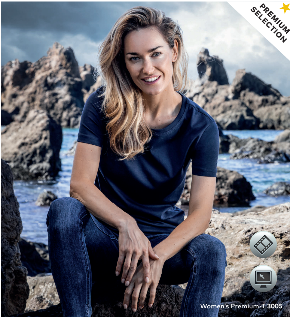
Women's Premium-T 3005