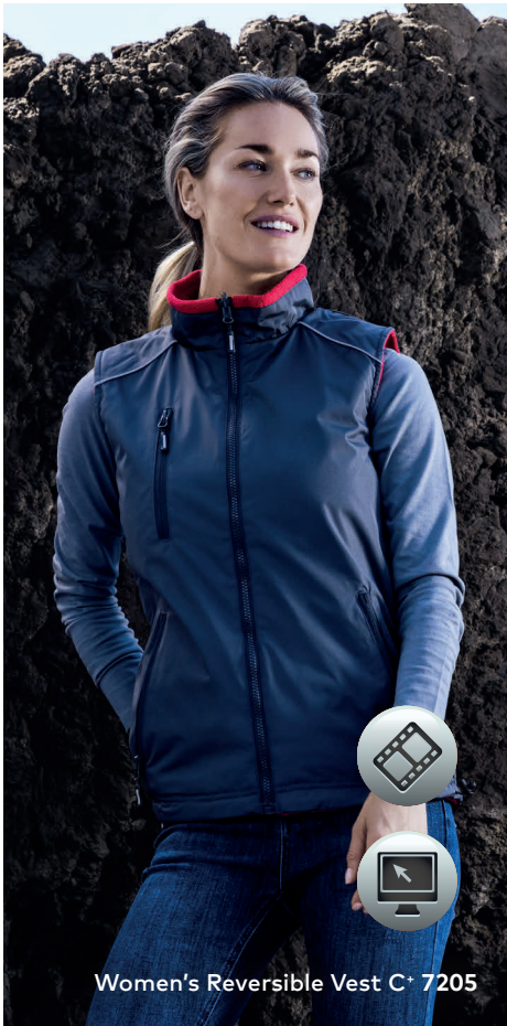
Women's Reversible Vest C+ 7205