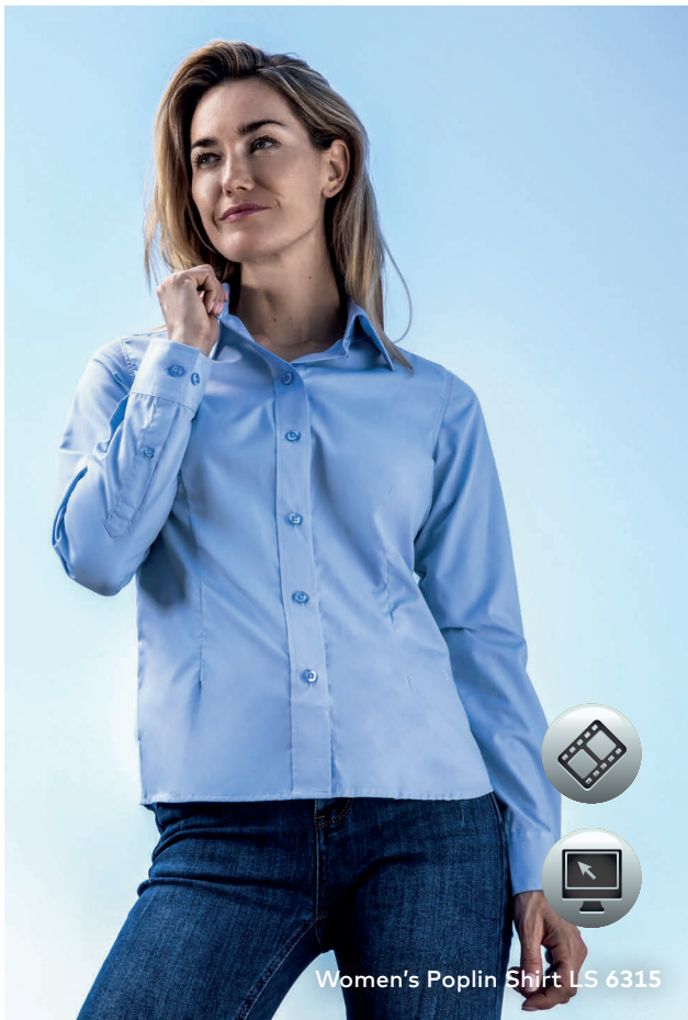
Women's Poplin Shirt LS 6315