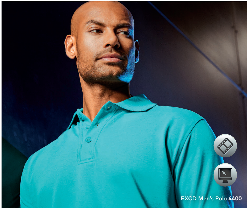
EXCD Men's Polo 4400