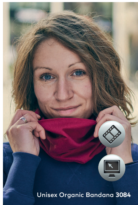
Unisex Organic Bandana 3084

Single-Jersey-Bandana, 2-lagig, hergestellt aus langstapeliger gekämmter zertifizierter (Bio-) Baumwolle mit Elasthananteil für Formbeständigkeit und Bewegungsfreiheit. Das Bandana ist mit Seitennähten gefertigt und bietet unterschiedliche Tragevarianten. Maße: S (Kind) ca. 24 × 23 cm, L (Erw.) ca. 26 × 25 cm. Die Bandanas sind vom Umtausch ausgeschlossen.