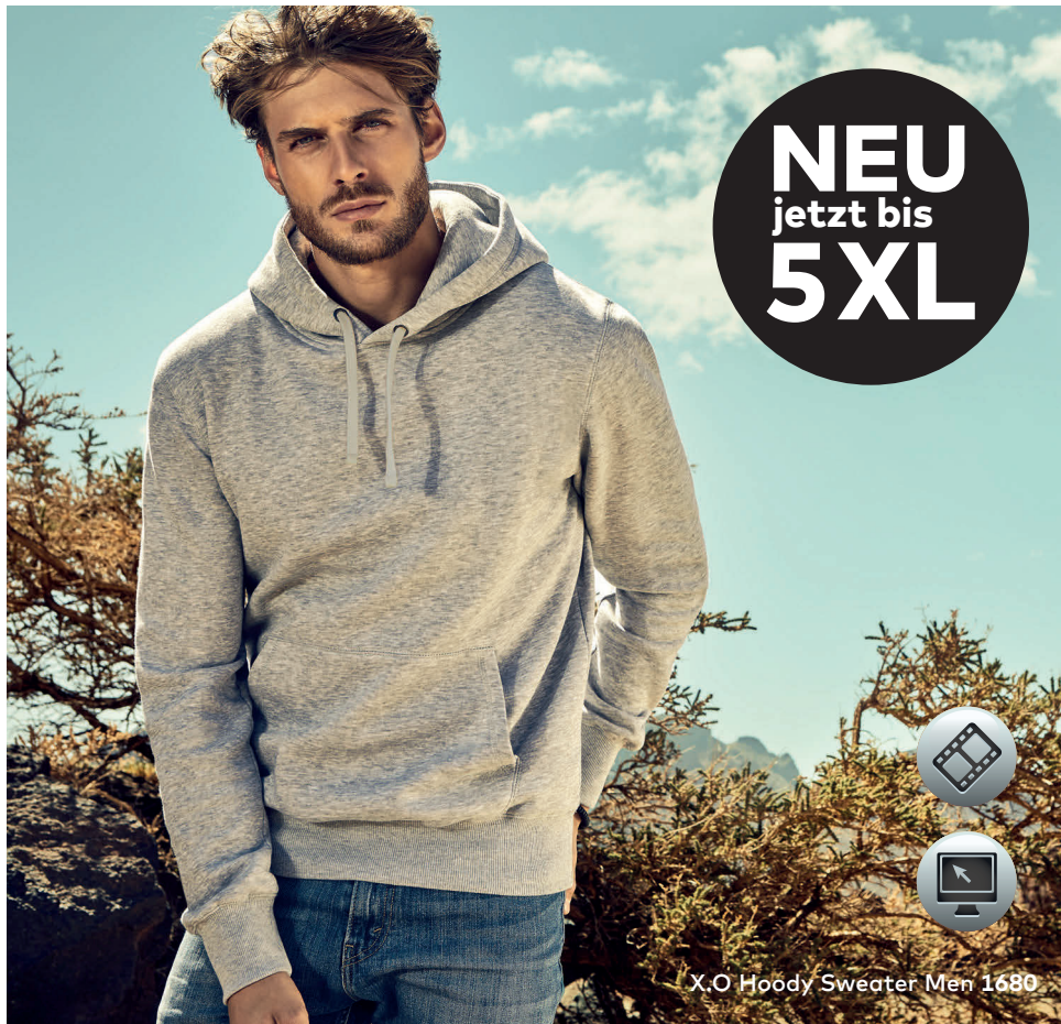
X.O Hoody Sweater Men 1680