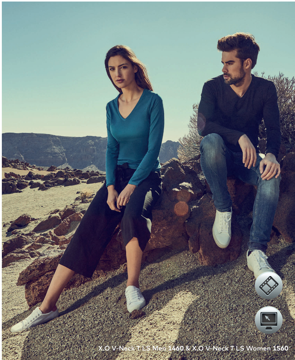
X.O V-Neck T LS Men 1460 &amp; X.O V-Neck T LS Women 1560