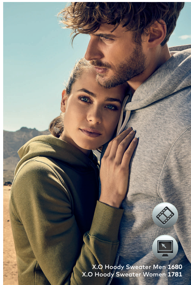
X.O Hoody Sweater Men 1680 X.O Hoody Sweater Women 1781

Einzigartiges Molton-Mischgewebe-Kapuzensweatshirt mit angerauter Innenseite, Kängurutasche und Elasthanbündchen an Hals, Ärmeln und Saum, hergestellt aus langstapeliger gekämmter Baumwolle und Polyester. Die besonders glatte Oberfläche und der weich fallende Stoff verleihen dem Sweatshirt ein einzigartiges, elastisches und seidiges Finish. Das Sweatshirt ist schmal geschnitten.