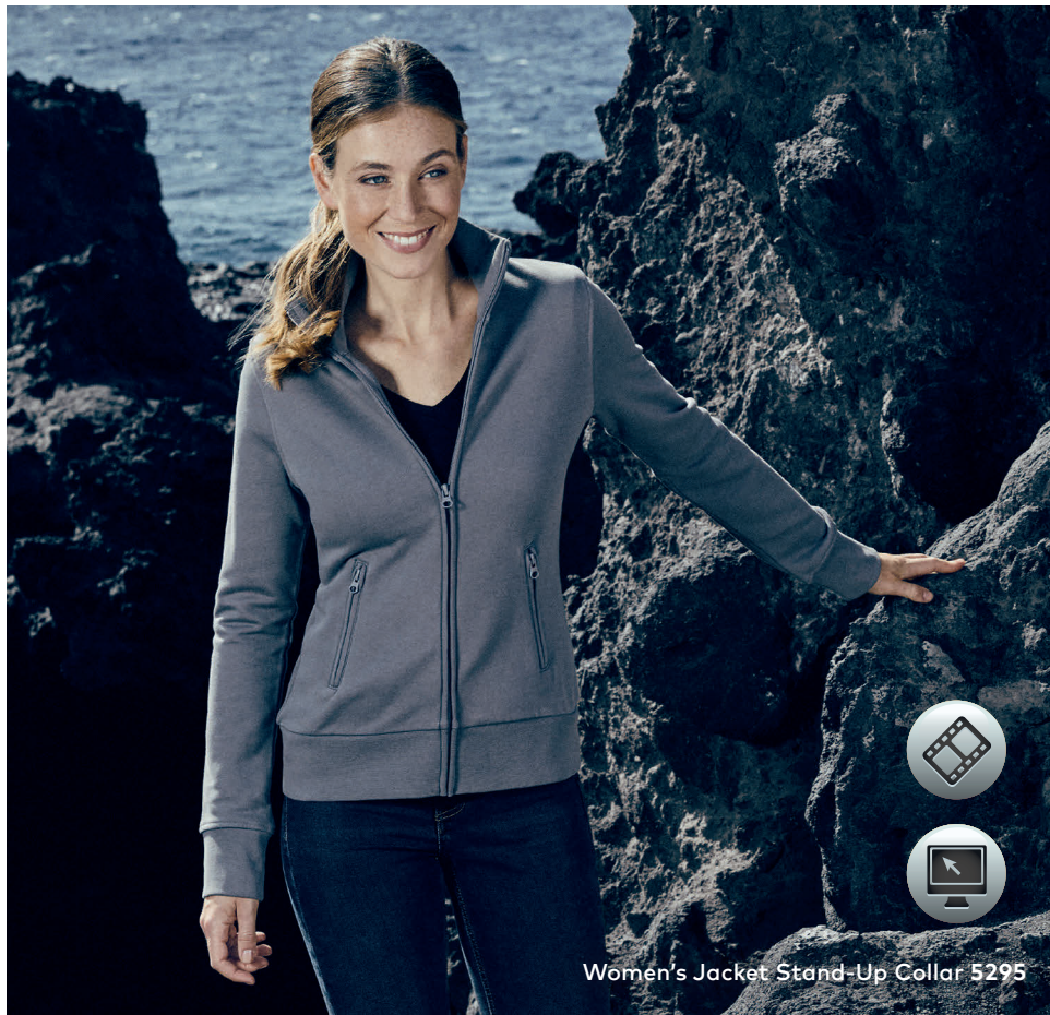
Women's Jacket Stand-Up Collar 5295