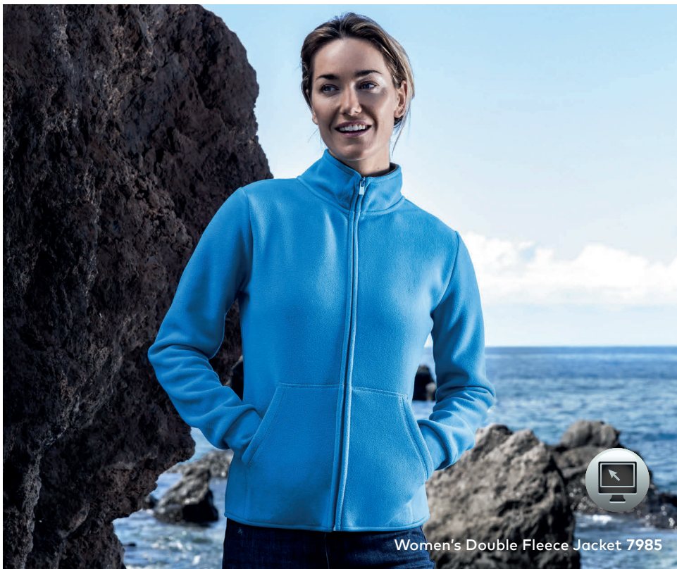
Women's Double Fleece Jacket 7985

Double-Fleecejacke mit Stehkragen und durchgehendem verdecktem Reißverschluss, Elasthanbündchen an Ärmeln sowie Einschubtaschen mit Ziernaht. Die Innenseite der Jacke ist in Kontrastfarbe, hergestellt aus Polyester mit beidseitiger Anti-Pilling-Ausrüstung. Die Fleecejacke ist schmal geschnitten.