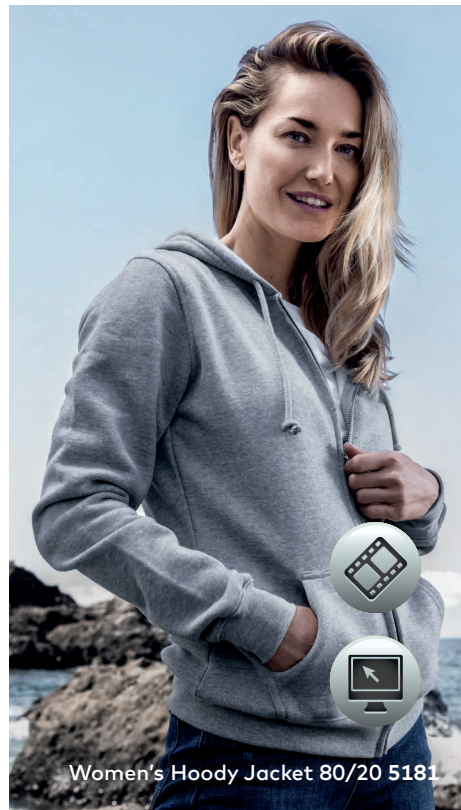
Women's Hoody Jacket 80/20 5181

Klassische Molton-Mischgewebe-Kapuzensweatjacke mit angerauter Innenseite und Elasthanbündchen an Ärmeln und Saum sowie einer Kängurutasche, Doppelkapuze und durchgehendem, verdecktem nickelfreiem Metallreißverschluss, hergestellt aus gekämmter Baumwolle und Polyester. Die Kapuzensweatjacke ist modern geschnitten.