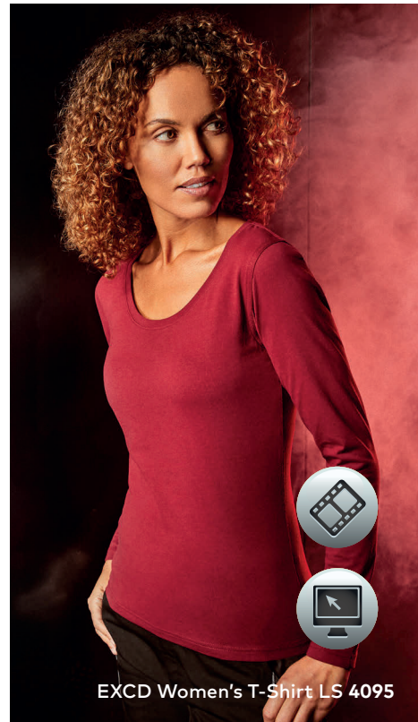
EXCD Women's T-Shirt LS 4095

Langarm-Workwear-Single-Jersey-Mischgewebe-T-Shirt mit femininem Ausschnitt bei Women und Elasthananteil im schmalen Rippbündchen, Schlaufen in der Seitennaht innen, hergestellt aus langstapeliger Baumwolle und Polyester mit der VORTEX® Spinning Technology. Die extrem glatte Oberfläche ist pillingresistent und hervorragend geeignet für jegliche Art der Veredelung. Verstärkte Schulter- und Doppelnähte sowie ein Nackenband vervollständigen dieses Produkt. EXCD überzeugt durch überdurchschnittlich langlebige Qualität, minimale Einlaufwerte und ist besonders pflegeleicht. Das EXCD Langarm-T-Shirt hat eine optimale Passform, und ist mit Seitennähten gefertigt. Dank des hohen Baumwollanteils bietet es maximalen Tragekomfort, für Industriewäsche geeignet, getestet nach ISO 15797.