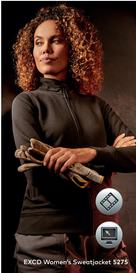
EXCD Women's Sweatjacket 5275