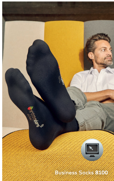
Business Socks 8100

Klassische Single-Jersey-Business-Socke, hergestellt aus überwiegend Baumwolle mit Polyamid und Elasthan. Zusendung nur von kompletten Verpackungseinheiten möglich.