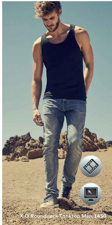
X.O Roundneck Tanktop Men 1450

Einzigartiges Single-Jersey Tank Top mit Self-Fabric Kragen, hergestellt aus langstapeliger gekämmter Baumwolle. Die besonders glatte Oberfläche und der weich fallende Stoff verleihen dem Shirt ein einzigartiges, elastisches und seidiges Finish. Das T-Shirt ist schmal geschnitten und mit Seitennähten gefertigt.