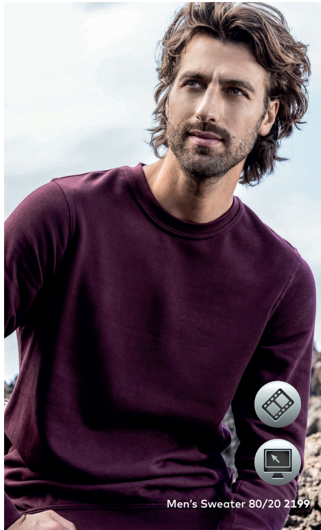
Men's Sweater 80/20 2199

Klassisches Molton-Mischgewebe-Sweatshirt mit angerauter Innenseite und Elasthanbündchen an Hals, Ärmeln und Saum, hergestellt aus gekämmter Baumwolle und Polyester. Das Sweatshirt ist modern geschnitten.