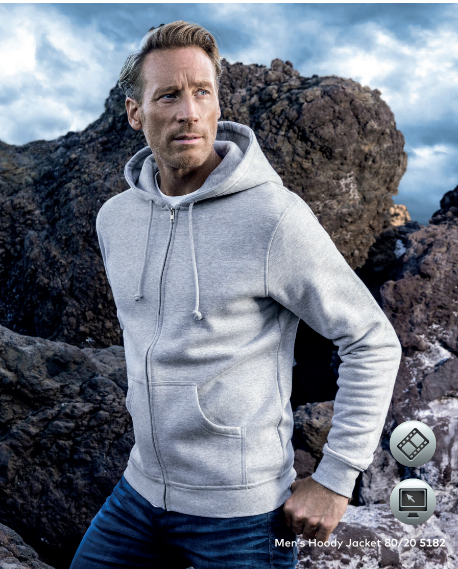
Men's Hoody Jacket 80/20 5182