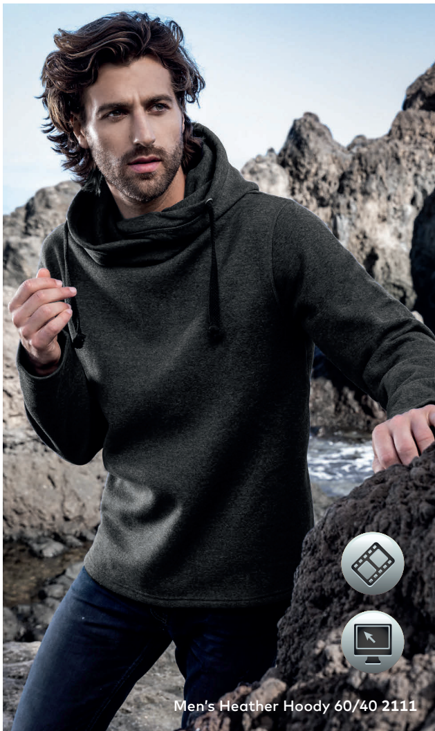
Men's Heather Hoody 60/40 2111