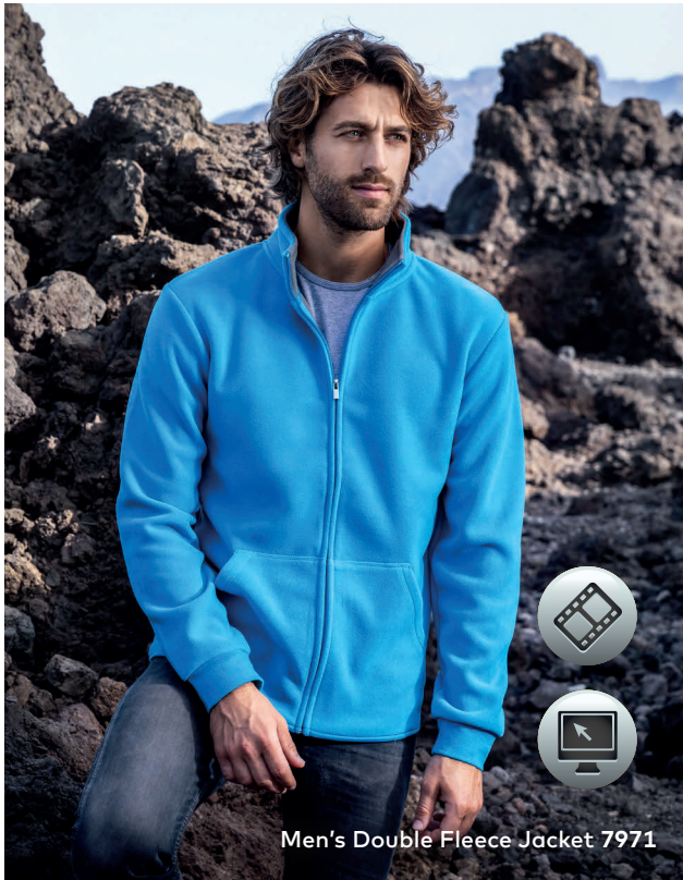
Men's Double Fleece Jacket 7971