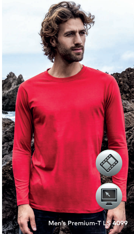
Men's Premium-T LS 4099

Klassisches Single-Jersey-Langarmshirt mit Elasthananteil im schmalen Rippbündchen, hergestellt aus langstapeliger gekämmter Baumwolle, die besonders feine Oberfläche ist hervorragend geeignet für jegliche Art der Veredelung. Das Langarmshirt ist modern geschnitten und aus Schlauchware gefertigt.