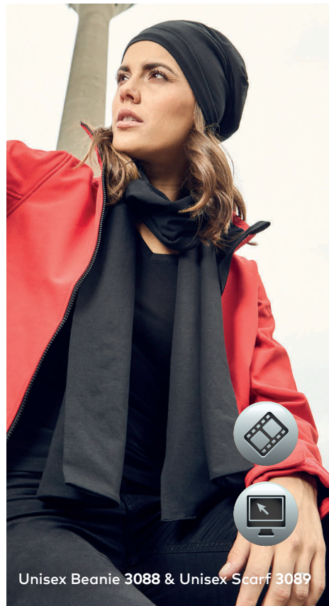
Unisex Beanie 3088 &amp; Unisex Scarf 3089

Unisex-Single-Jersey-Beanie, doppellagig, Tear-Off-Label zum einfachen Heraustrennen. Unisex-Single-Jersey-Schal, doppellagig, Maße 180 cm × 30 cm, Tear-Off-Label zum einfachen Heraustrennen, hergestellt aus gekämmter Baumwolle mit Elasthananteil für Formbeständigkeit.