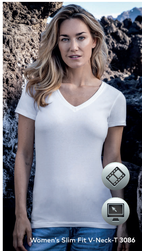
Women's Slim Fit V-Neck-T 3086

Modernes Single-Jersey-V-Ausschnitt-T-Shirt mit eingefasstem Kragen bei Men und Elasthananteil im schmalen Ribbbündchen bei Women, hergestellt aus gekämmter Baumwolle mit Elasthananteil für mehr Bewegungsfreiheit. Das T-Shirt ist eng anliegend geschnitten und mit Seitennähten gefertigt.