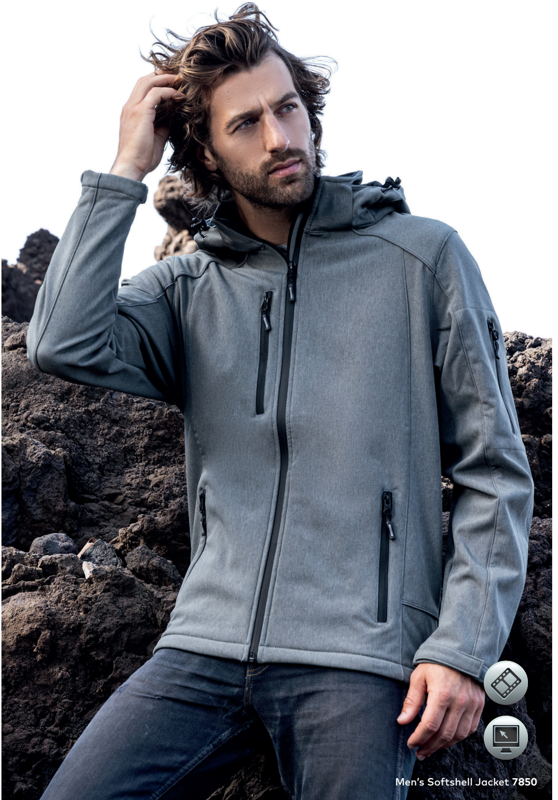
Men's Softshell Jacket 7850