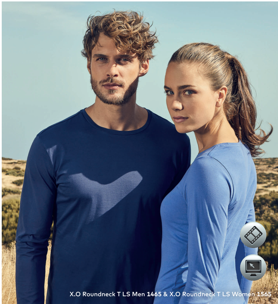
X.O Roundneck T LS Men 1465 & X.O Roundneck T LS Women 1565

Einzigartiges Single-Jersey Langarmshirt mit Self-Fabric Kragen, hergestellt aus langstapeliger gekämmter Baumwolle. Die besonders glatte Oberfläche und der weich fallende Stoff verleihen dem Shirt ein einzigartiges, elastisches und seidiges Finish. Das T-Shirt ist schmal geschnitten und mit Seitennähten gefertigt.