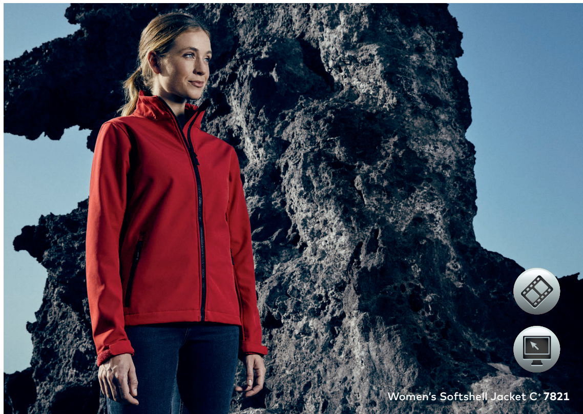
Women's Softshell Jacket C 7821